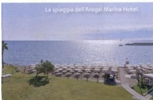
La spiaggia dell'Aregai Marina Hotel.