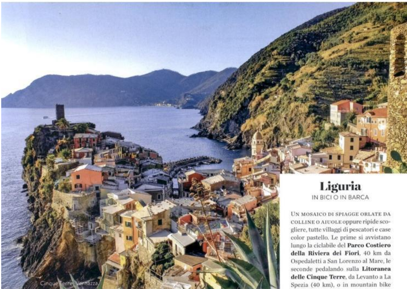
Cinque Terre, Vernazza