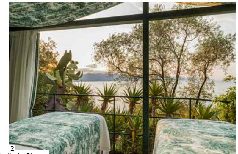
1 & 2 : Spa Dior « Jardin des Rêves » 3 & 4 : Plage de Bagni Fiore